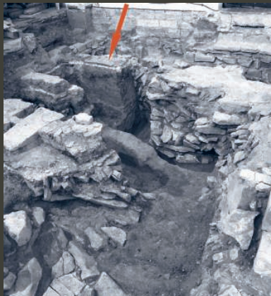
Situace ve střední části kostela, dochovaná část dlažby označena šipkou.