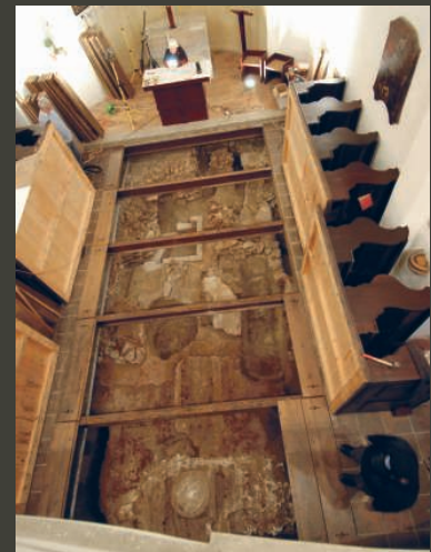
Pohled do lodi kostela s částečně zvednutou dřevěnou podlahou.