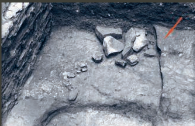
Situace zjištěná v sondě VI u západního průčelí kostela. Vlevo základy kostela, uprostřed šipkou označený nevysoký zbytek hrany rotundy, jehož průběh je dole porušený výkopem mladšího objektu.