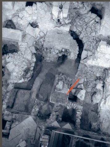
Východní část kostela v době výzkumu. V horní části zřetelně výrazné zdivo základů rotundy, ve spodní části uprostřed plochy poníčené výkopy hrobových jam, je šipkou označena jedna z dochovaných ploch dlažby.