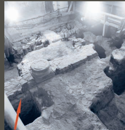
Západní část kostela s patkou sloupu, který nesl tribunu románského kostela. Jeho původní podlaha byla tvořena silnou vrstvou upéčovaného jílu. Ta překrývá jednu z dlaždic dochovaných na původním místě (šipka).