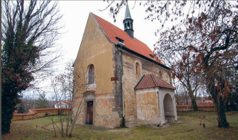
Kostel sv. Jana Křtitele (Dolní Chabry, Praha 8), Pohled od jihozápadu.