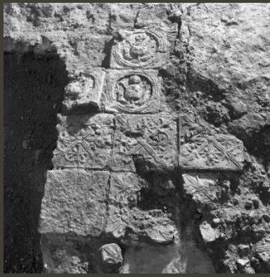
Na některých dlaždicích se naopak reliéf dochoval v podivuhodně výšce.