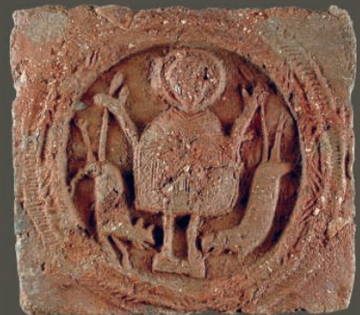
I na ploše reliéfu jsou hrubé příměsi dobře patrné.