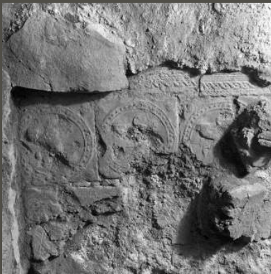
Na jedné z dochovaných ploch byl reliéf dlaždic téměř neznatelný. Bylo to způsobeno oslabením návštěvníky, nebo z jiných, dosud neznámých příčin?