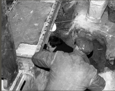
Fotografii z vyzvedávání dlažby se nedochovalo mnoho.