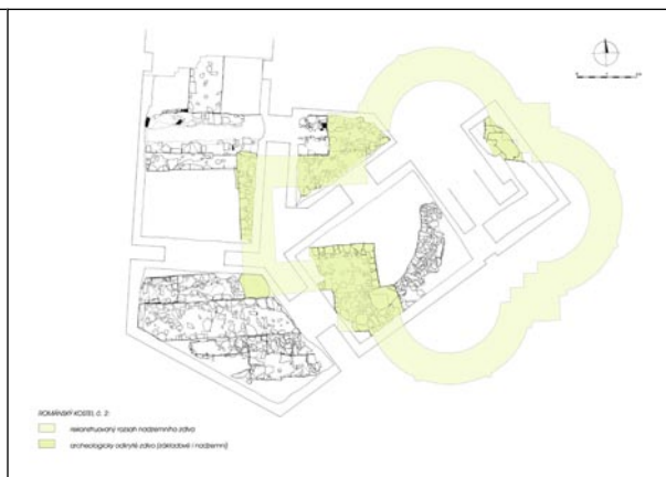
Zvýrazněná situace nalezených pozůstatků románské centrály z 2. poloviny 12. století.