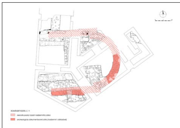
Zvýrazněná situace nalezených pozůstatků nejstarší kostelní stavby z přelomu 11. a 12. století.