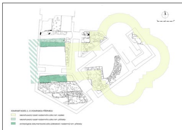
Zvýrazněná situace nalezených pozůstatků románské centrály a její západní přístavby z přelomu 12. a 13. století.