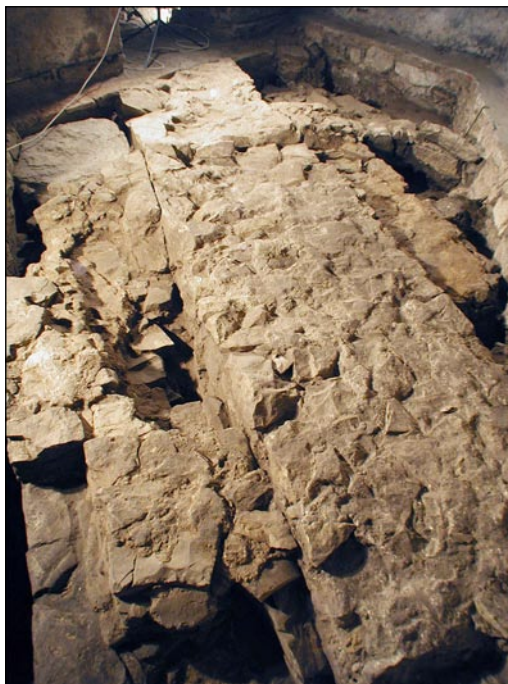
Jednotlivé stavební fáze kostela se postupně natolik překrývaly a doplňovaly, že některá místa výzkumu byla zcela zaplněna zdi. Záběr zachycuje masivní základ jižní stěny gotické lodi (uprostřed), po jejímž obvodu se nalézala torza zdí starších románských staveb.