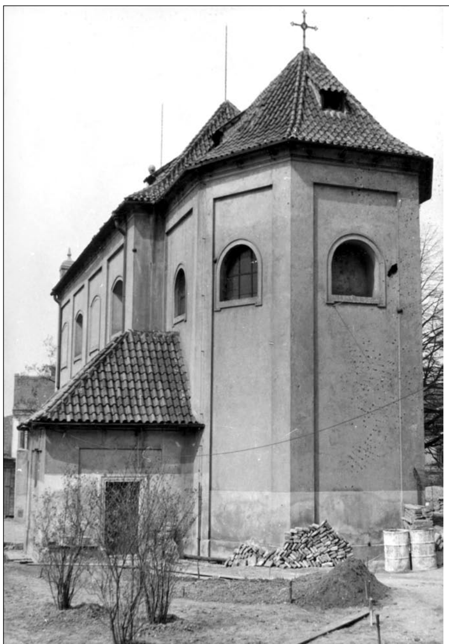
Nenápadný kostel dodnes skrývá svůj gotický vzhled pod barokní fasádou.

Při výzkumu H. Olmerové v kostele sv. Pankráce ve stejnojmenné pražské čtvrti bylo velkým překvapením odkrytí prosté románské rotundy, součásti osady Krušina v předpolí Vyšehradu.