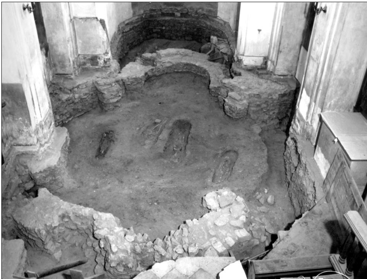
Téměř celý půdorys románské rotundy byl odhalen uvnitř gotické stavby. Dva z odhalených hrobů jsou interpretovány jako možné pohřby rodiny zakladatele kostela.