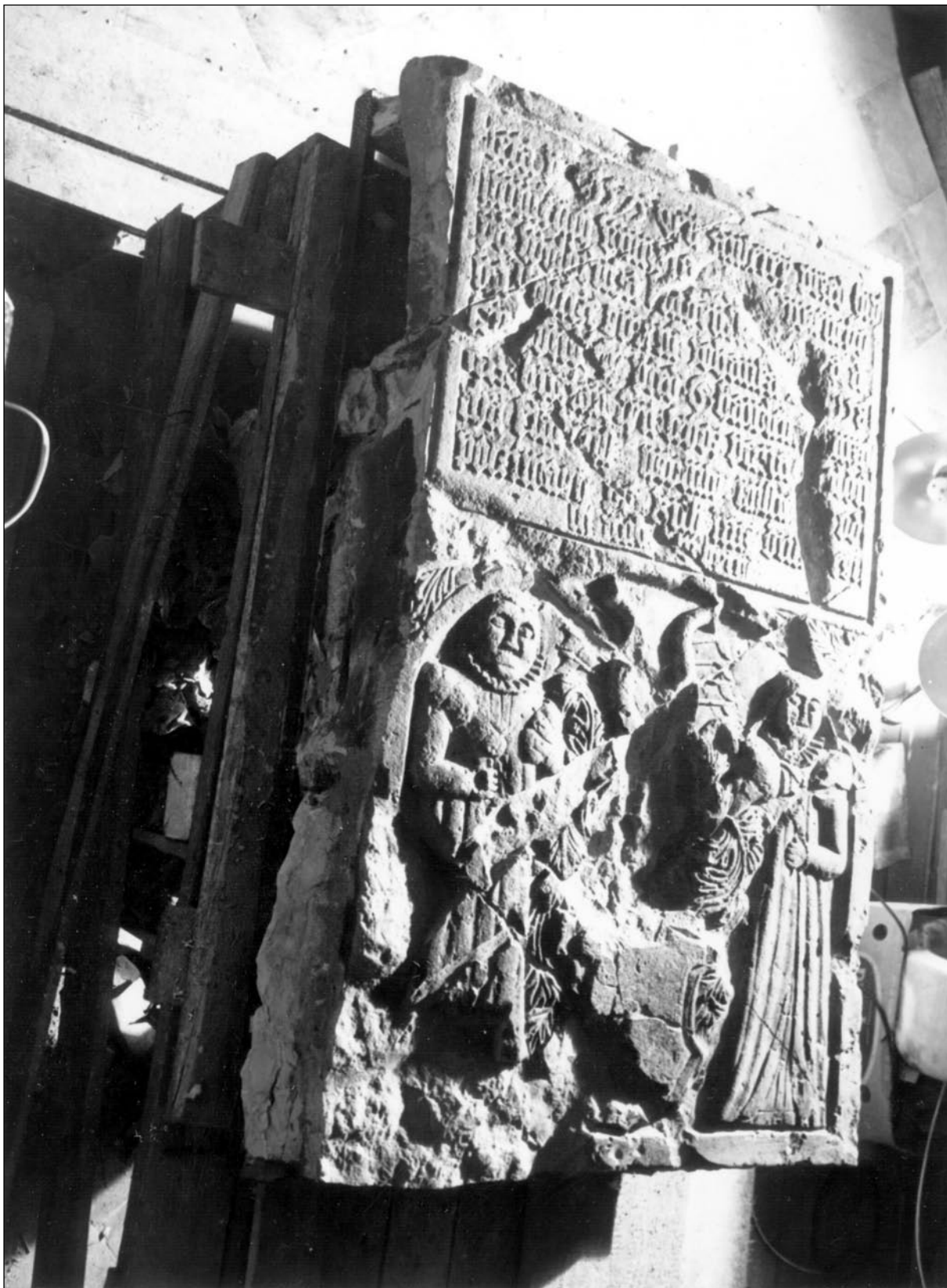
Archeologický výzkum odkryl rovněž kvalitní renesanční náhrobní kámen z konce 16. století, upomínající na manželku Johanku a matku Oldřicha Radeusta, pána na Lhotce.