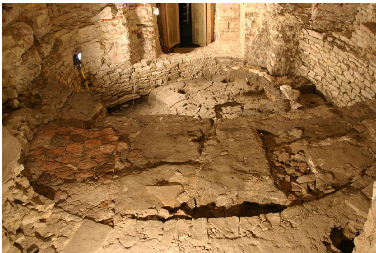
Pohled na celkovou situaci.