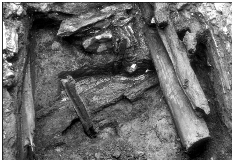
Dřevěná stěna roubeného domu 11./12. století se dochovala v místě, kde se již před jejím vznikem vytvářel sled dřevěných konstrukcí, dnes obtížně přehledný.