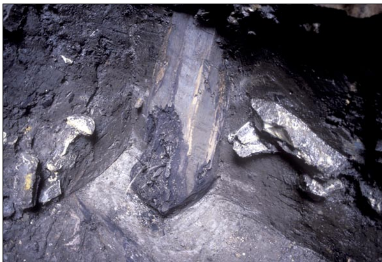
V jižní části nádvoří stála konstrukce se sloupy otesanými do osmihranů, která s největší pravděpodobností náleží opevnění 10. století.