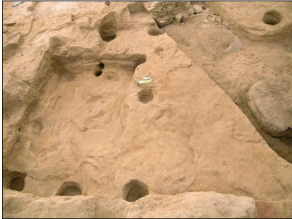
Jižní část superpozice zahloubených částí dvou domů