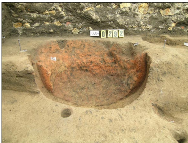
Pomocný řez výpalem pece.