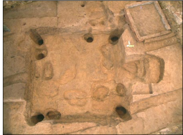
Zahloubená část domu (V872) po vybrání výplně.