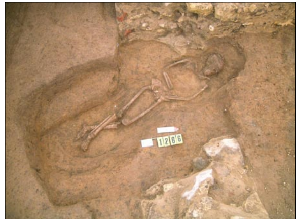
Atypický, zatím bližze nedatovatelný, hrob.