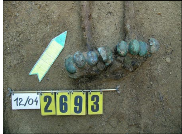
Náložní kruhy v keltském hrobu.