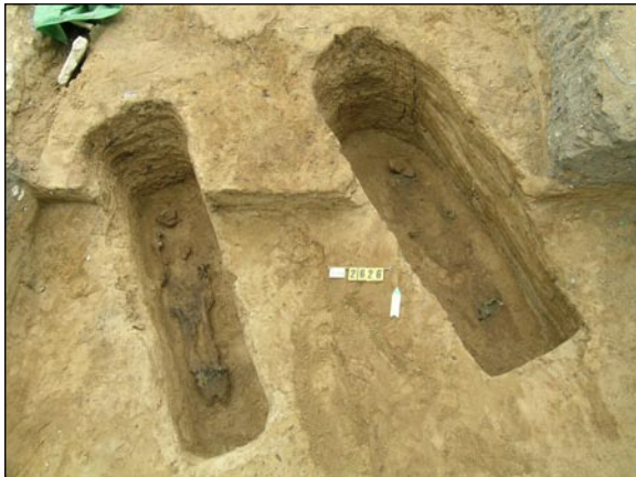
Hrobové jámy keltských hrobů z laténského období.