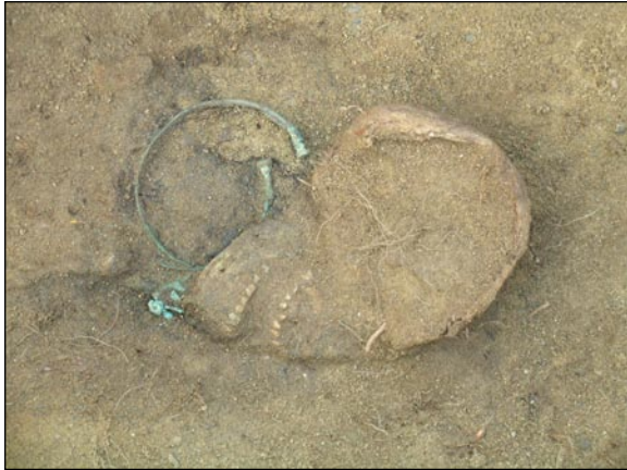
Detail lebky s torques - keltský hrob z období laténského.