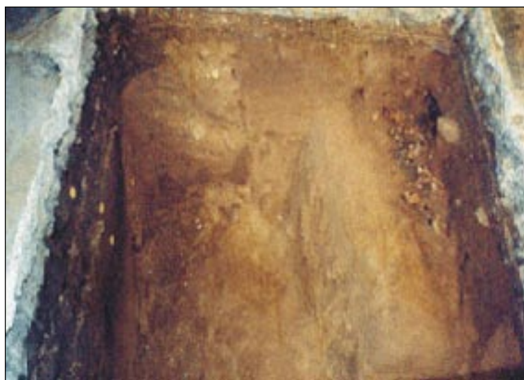
FOTO 1: HROMADNÝ HROB VIII v SONDĚ A2 A) POHLED OD JIHU NA ČÁSTEČNĚ ODKRYTÝ HROB, B) DETAIL VYKOPANÉHO HROBU

Obrovským překvapením bylo objevení hromadného hrobu (hrob VIII, viz foto 1) s částmi těl několika jedinců. Vzhledem k tomu, že dosud není hotov antropologický posudek prováděný V. Kuželkou z Národního muzea, je jakákoliv interpretace předčasná. Rozhodně se jedná o jev, který nemá analogii v prostředí židovské kultury. Zatím je možné konstatovat pouze skutečnost, že části těl několika jedinců, z nichž některé nesly známky velkého žáru, byly uloženy v dřevěné rakvi (60 x 100 cm) v mělké jámě.