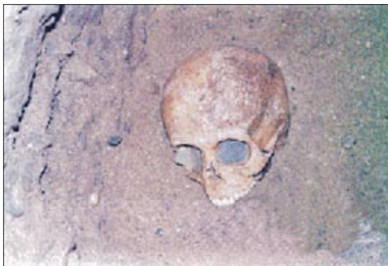
FOTO 2: POHLED NA LEBKU S BŘIDLIČNÝMI DESTIČKAMI NA OČÍCH - HROB XXIX v SONDĚ I1