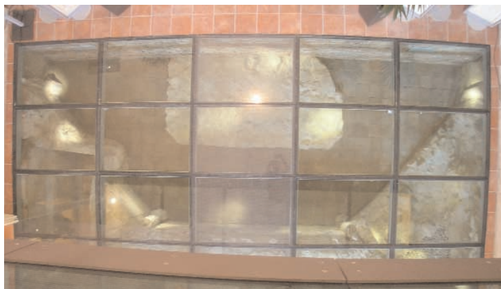
Obr. 5. Praha, Malá Strana, kostel sv. Maří Magdalény, pod nazelenalou skleněnou podlahou je při pohledu z výšky zřetelná vnitřní brana závěru presbytáře i blok zdiva základů oltářní menzy. Vlevo část dodatečně vložené cihlové barokní hrobky.