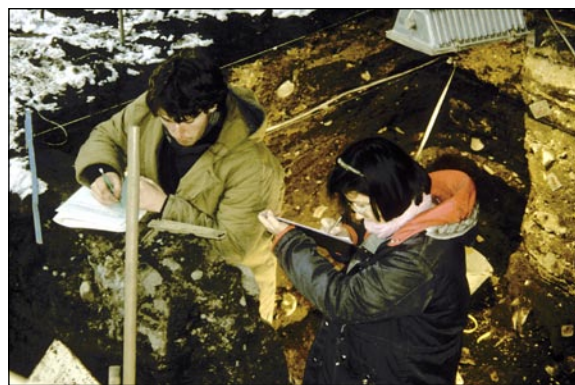
Oblečení, provizorní zastřešení, umělé osvětlení i zbytky sněhu jasně charakterizují konečnou fázi výzkumu.