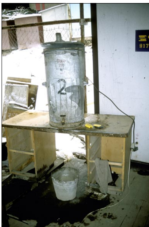
Popelnice s kohoutkem a ponorným vaříčem (tzv. Vachudova koupelna) představovala na výzkumu v zimě 2002 – 2003 jediný zdroj teplé vody.