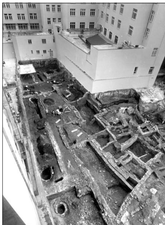
Na ploše parcely bylo odkryto množství kamenných staveb, provázených četnými studněmi a odpadními jímkami.