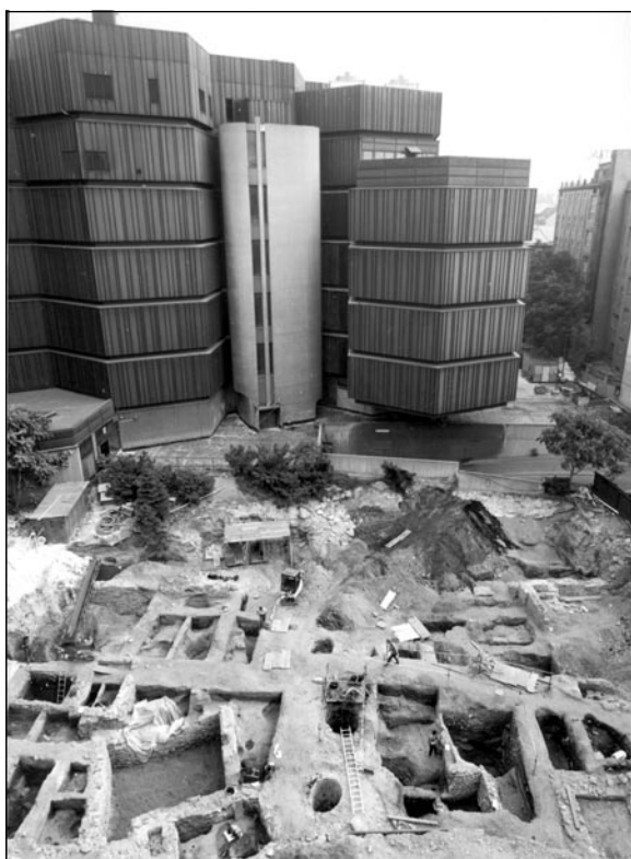
Setkání středověku a současnosti.

Hektický rok 1992 přinesl dva rozsáhlé výzkumy na východním okraji Starého Města. Výzkum v proluce Myslbek (duben – říjen) se časově překrýval s výzkumem v Rybné ulici za obchodním domem Kotva (červenec 2004 – únor 2005) a podobným způsobem se překrývalo vedení výzkumu (Zd. Dragoun a M. Tryml) i široký pracovní kolektiv. Na rozdíl od výrazně mladšími zásahy poničenému areálu Myslbeku bylo na staveništi dnešní burzy cenných papírů odkryto množství staveb a jejich příslušenství s enormním množstvím předmětů středověké materiální kultury.