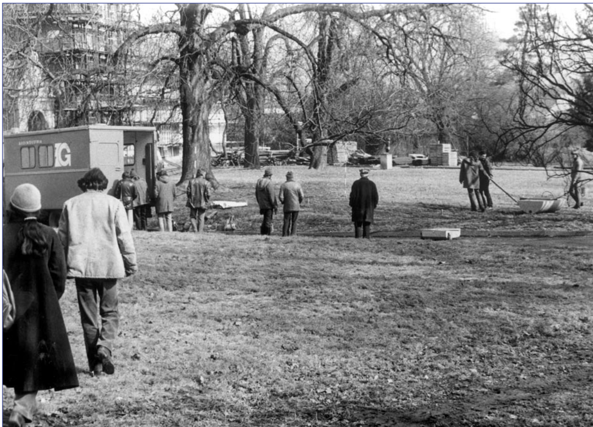
Součástí archeologické akce byl i geofyzikální průzkum zámeckého parku, na jehož ploše se nacházejí základy klášterního kostela.