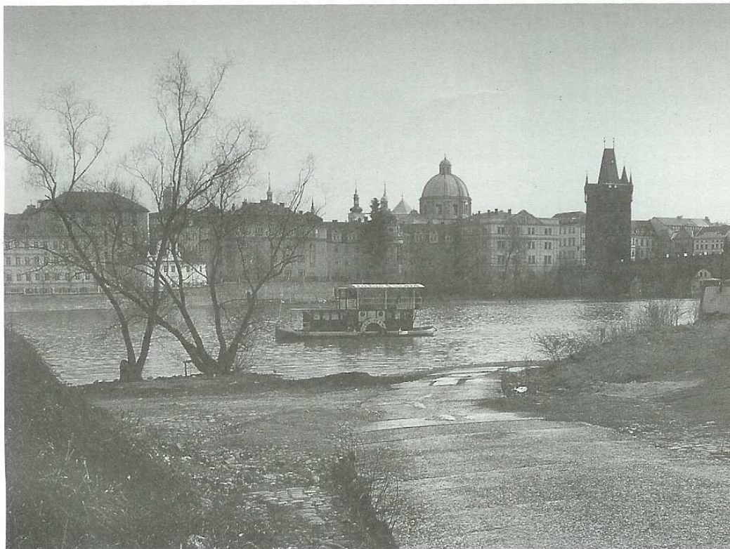
Jediný kus přirozeného břehu Vltavy je dnes pod Mánesovým mostem.

Na město můžeme pohlížet jako na hustě osídlenou krajinu, jakousi krajinu naruby, v níž převládá kultura nad naturou. Co se v krajině odehrává na velkém území, probíhá v ulicích měst s mnohem větší intenzitou. I kdybychom chtěli, nepodaří se nám z města vyhnat to přírodní a divoké. Svým sídlením na to nicméně tlačíme. Část vpouštíme vědomě (např. ovocné stromy nebo kozy), část se nám daří vyhnat (např. les nebo medvědi), část necháváme bujet tam, kde nedochází ke křížení zájmů nebo kde je boj příliš vysilující (např. rumiště, ptáci, hmyz).