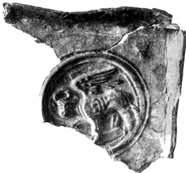
OBR. 2. PRAHA - STARÉ MĚSTO, LINHARTSKÁ UL., KOSTEL SV. LINHARTA, PLAKETA SE SYMBOLEM EVANGELISTY LUKÁŠE.

kladní kámen s vytesanou dutinou o rozměrech 7,5 x 10,6 cm, hlubokou 5,5 cm, zjevně pro vložení podobného předmětu (apotropaion). Zápis v inventární knize zmiňuje existenci olověné destičky (vel. 6, 5 x 5,5 cm) s vyrytou postavou okřídleného lva držícího pásku s nápisem Marcus. Písmo je charakterizováno jako gotické a je datováno do 15. století. Schránka byla uzavřena 2 cm silnou opukovou deskou. Olověná destička uložená při objevu v r. 1938 v kamenném je dnes bohužel ztracená. Kámen pochází údajně z výkopu v domě čp. 277/II v ulici Na zbořenci na Novém Městě pražském 5) . Na parcelu tohoto domu patrně zasahovalo klášterství románského křížovnického řeholního domu s kostelem sv. Petra, když konvent křížovníků Božího hrobu byl uveden před r. 1188 ke kostelu připomínanému poprvé k r. 1115 6) . I v tomto případě tedy může nálezný předmět pocházet ze sakrální stavby. I když devocionálně z prostoru kostela sv. Linharta nebyla nalezena přesně v místě svého původního uložení, pochází zřejmě ze spodní partie základů severovýchodního nároží lodi románského kostela. Její původní umístění předpokládáme ve speciálně upraveném základním kamenném tohoto nároží. Vlastní zpracování nevelkého reliéfu nedovoluje detailní chronologické zařazení, ale rozhodně nebrání jeho datování do románského období.