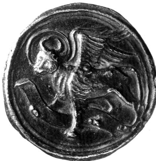
OBR. 3. PRAHA. KOPIE PLAKETY SE SYMBOLEM EVANGELISTY LUKÁŠE ZE ZÁKLADŮ NEURČENÉHO KOSTELA ZE SBÍREK MUSEA HLAVNÍHO MĚSTA PRAHY.