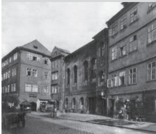
▲ Nová synagoga, pohled na jižní frontu bývalé Josefské třídy. Synagoga stála v místě dnešní křižovatky Pařížské a Široké ulice. Foto J. Eckert, 1896 (Bečková et al. 2004).