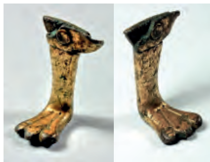
▲ Nožička chanukového svícnu z pozlaceného stříbra. Dva pohledy na nález, který pochází ze středověkého objektu odkrytého při archeologickém výzkumu v roce 1998 pod podlahou Staronové synagogy.