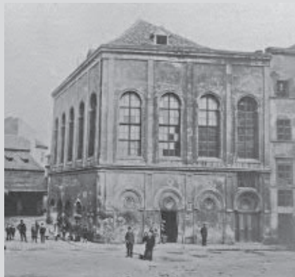
▲ Velkodvorská synagoga, krátce před zbouráním. Autor neznámý, 1905–1906; © MMP, inv. č. H 121454.