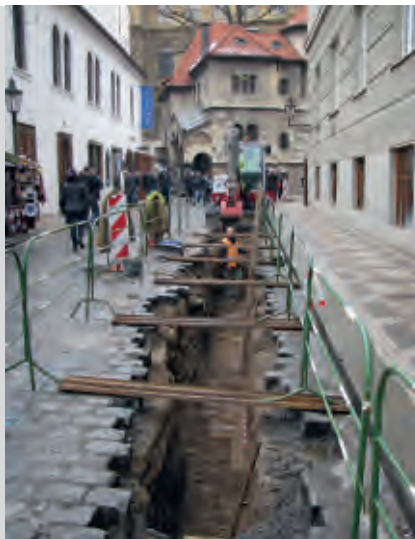
▲ Archeologický výzkum pozůstatků předasanační zástavby ve výkopu pro vodovod v ulici U Starého hřbitova. Zdi původních domů Židovského Města se místy nalézají bezprostředně pod současnou dlažbou ulice.