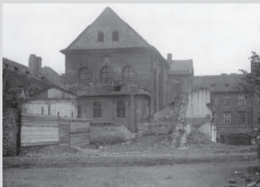
▲ Cikánova synagoga v době asanace Josefova. Pohled na západní průčelí krátce před zbořením. Autor neznámý, 1905; © MMP, inv. č. HNX 73.

naléžt již do 2. poloviny 11. století. Předpokládá se, že v průběhu 12. století se rozvíjejí židovské osady v okolí Staré a Staronové synagogy. Početná židovská enkláva se tak rozkládala nedaleko od tržiště v místě dnešního Staroměstského náměstí. S pomocí osteologické analýzy kostí pocházejících z kuchyňského odpadu, v němž jednoznačně převládaly kosti hovězí a v menší míře i skopové a drůbeží, bylo možné doložit, že již v nejstarším období zde sídlili Židé, neboť v jejich jídelníčku se z náboženských důvodů nevyskytuje vepřové maso. Archeologické poznatky odpovídají nejstarší zmínce o pražských Židech z roku 1096. Židovské osídlení se postupně rozvíjelo a krátce po roce 1230 bylo začleněno do nově vybudovaných hra-